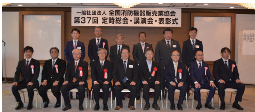
功労者表彰受賞者