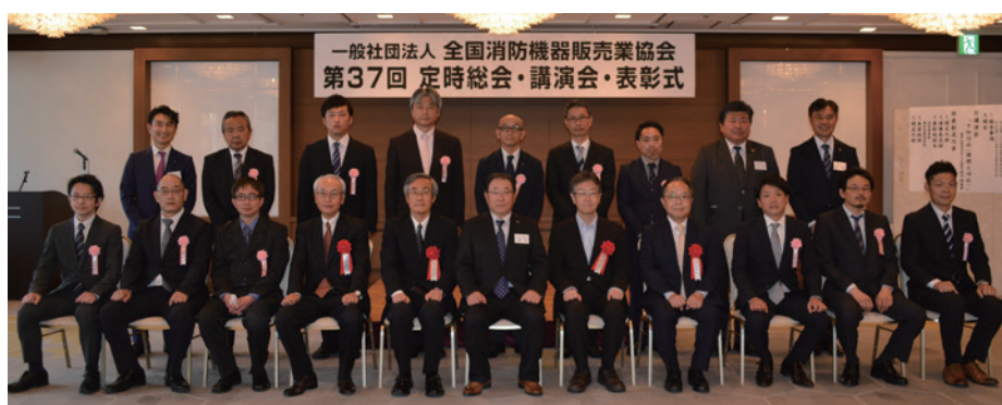
優良従業員表彰受賞者