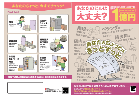
② 避難施設の維持管理

避難設備等の維持管理は非常に重要であり、避難設備等に係るチェックポイントをイラスト入りでわかりやすく明示した内容となっています。