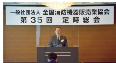
臼井理事長ご挨拶

コロナ下であり、当日出席した会員は例年の約3割でしたが、委任状、議決権行使書の受領により、出席率93%のもと全議案が承認され無事に終了することができました。ご協力に感謝申し上げます。