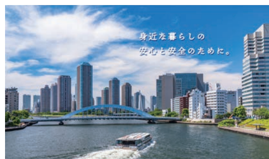
全消販ホームページより

書面による定時総会は、理事長から以下の議案提案があり、会員各位から「同意書」を受領する形式で実施されました。全会員から「同意書」を受領いたしました。ご協力に感謝申し上げます。